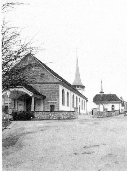
Rénovation de l'ancienne église à Tavel (FR)