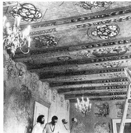
... et après rénovation

Se fondant sur l'article 24 sexies de la constitution adopté par le peuple et les cantons en 1962, la Confédération a promulgué en 1966 la loi sur la protection de la nature et du paysage . La protection fédérale des monuments, qui n'était réglementée jusque-là que par un arrêté fédéral, a reçu par