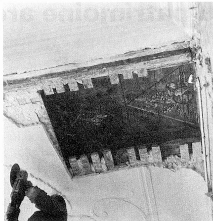
A Laufon, Berne, plafond de l'hôtel de ville avant ...

La Confédération participe financièrement à la conservation des monuments historiques depuis les années 80 du siècle dernier. Le premier arrêté fédéral date de 1886, l'actuel de 1958. En vertu de cet arrêté, «la Confédération encourage la conservation des monuments historiques en allouant des subventions, pouvant s'élever jusqu'à 50 pour cent des frais, pour leur restauration, pour leur exploration archéologique, pour leurs relevés et pour les fouilles qui y sont effectuées ...». La Confédération place sous sa protection tout monument architectural à la conservation duquel elle collabore en vertu de l'arrêté fédéral de 1958. Cette protection consiste pour l'essentiel dans l'inscription au registre foncier de l'obligation du propriétaire d'entretenir le monument et de n'y apporter aucun