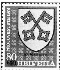
Wangen a. d. A. (BE)