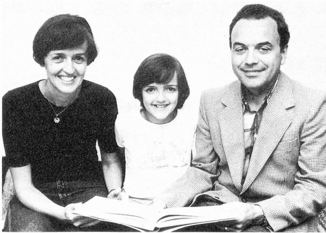
Le professeur et chercheur Werner Arber remporte le prix Nobel en médecine. Ici en compagnie de son épouse et de leur fille.