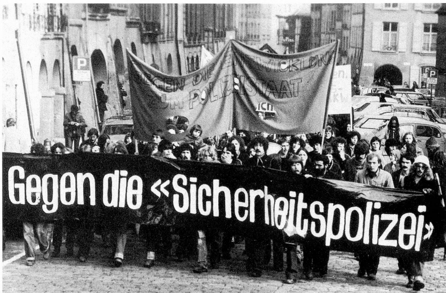
Rejetée par le Souverain, la police fédérale de sécurité n'en n'a pas moins suscité d'âpres controverses.