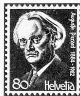
Auguste Piccard 1884-1962 Physiker Fisicista