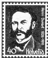
Henri Dunant 1828-1910 Philanthrop Philanthrope Filantropo