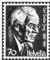
Carl Gustav Jung 1875-1961 Psychologe Psychologue Psicologo