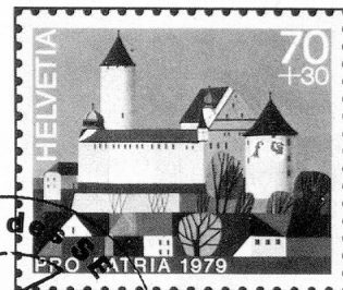
Château de Porrentruy