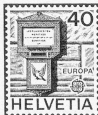
Historischer Briefkasten aus Basel Boîte aux lettres historique de Bâle Buca delle lettere storica di Basilea