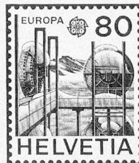
Alpine Relaisstation Jungfrauoch Station relais alpine du Jungfrauoch Ripetitore d'alta montagna dello Jungfrauoch

Entwürfe Dessins Klaus Oberli, Bern Disegni