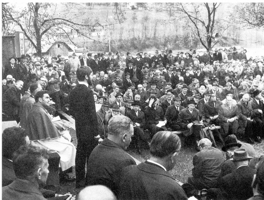
Landsgemeinde à Stans

du canton, ne reçoit pour ainsi dire pas de soleil durant les mois de décembre et de janvier.