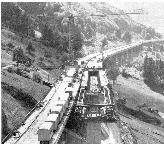
Construction d'un viaduc entre Beckenried et Rüteneu