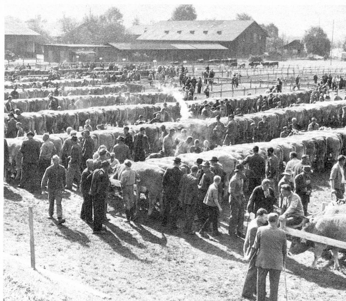
Marché aux bestiaux à Wil

nales, suivis de votations et d'élections. Le grand nombre et surtout la complexité des objets deviennent de plus en plus difficiles à être traités dans la forme actuelle. Cela conduit à une oligarchie vu que les citoyens voient leur rôle se borner à suivre le point de vue de la minorité dirigeante. Il faut aussi prendre garde à ce que la Landsgemeinde ne devienne pas purement et simplement une manifestation folklorique.