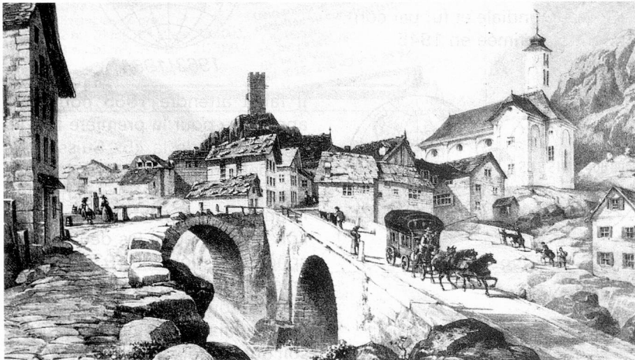
La diligence du St-Gothard passant en 1843 le village d'Hospental

« Saint-Gothard – VIA HELVETICA » par Arthur Wyss, conservateur du Musée des PTT à Berne. Traduit par Amédée Torche, Fribourg (avec préface du conseiller fédéral Willy Ritschard). Cet ouvrage richement illustré et rédigé de façon captivante est une vaste fresque des faits qui ont contribué de manière décisive à l'histoire du Gothard, fresque qui met en relief les impulsions d'ordre politique que ce col a engendrées et qui ont profondément marqué le devenir de la Confédération suisse. Il est en même temps une profession de foi pour ce passage le plus central des Alpes. Ses quelque 300 illustrations – dont plus de 50 en couleurs – tirées d'images, de documents, d'anciens cachets et oblitéra-