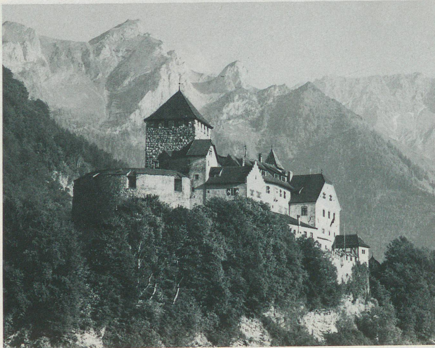
Le Château de Vaduz

traces toujours visibles sur notre territoire. Venant de l'ouest et du nord-ouest, elles ne furent point connues plus à l'est. Grâce à des recherches, il est aisé de suivre l'évolution de l'âge du bronze dans la partie supérieure de la vallée du Rhin. On constate même à l'âge avancé du bronze, le développement d'une culture propre dans la région des Alpes, connue sous la dénomination de «Melauner-Kultur», dont le rayonnement s'étendit à la partie ouest du territoire. Très certainement, les objets de cette culture, dont toute la région fut dotée, et qui sont par ailleurs difficilement définissables, feront toujours défaut. Une continuité dans l'habitat du territoire du Liechtenstein a pu être prouvée par l'archéologie pour les différentes phases de l'âge du fer. De l'époque étrusque reculée (env. 500–15 av. J.-C.) on a découvert à plusieurs reprises une spécialité de céramique dite d'Eschnerberg, à laquelle les ouvrages d'étude touchant l'archéologie ont attribué la mention de: «céramique rapide». Il convient encore de signaler les