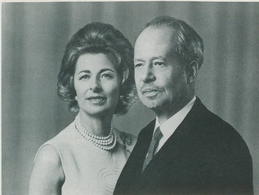
Le Prince et la Princesse de Liechtenstein

Pour Aristote, les frontières d'un état sont d'essence autarcique dans l'ensemble des domaines comme il aime à le souligner par cette parole: «Pour la pleine satisfaction de la vie.» La technologie moderne, ainsi que le monde civilisé, ont rendu fort relative la notion d'autarchie. En lieu et place, la dépendance s'est instaurée que l'on se plaît à nommer interdépendance. L'évolution met en danger le petit état, mais ne le tue point. Force de persuasion et fantaisie sont ses attributs de prédilection qui servent d'ailleurs aujourd'hui de modèle pour le monde. Citons le dramaturge moderne Friedrich Dürrenmatt: «...Je peux me représenter un écrivain; un écrivain qui a un plaisir incommensurable d'être du Liechtenstein, et seulement du Liechtenstein, pour qui le Liechtenstein représente beaucoup plus que les 61 kilomètres carrés de sa surface effective. Pour cet écrivain, le Liechtenstein est le modèle d'un monde en devenir qui va prendre forme et se répandre, faisant de Vaduz une Babylone, et pourquoi pas du prince, un Nabuchodonosor. Le peuple du Liechtenstein protestera certainement, criant à l'exagération, à l'abandon du folklore régional et de la production du fromage. Mais cet écrivain ne sera pas seulement représenté à Saint-Gall, son audience deviendra internationale, car le monde se reconnaîtra dans la découverte de son Liechtenstein. Cet écrivain du