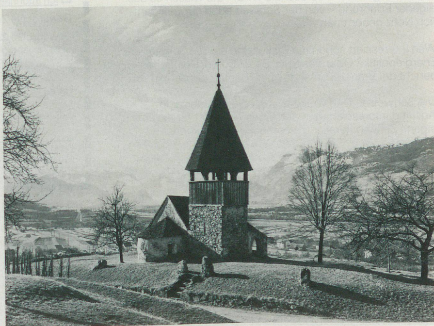
La chapelle de Triesenberg

trouvait à côté des nobles, les couvents de Saint-Gall et de Weingarten. De son côté la famille princière du Liechtenstein fit également des offres. Il est possible de suivre l'évolution de la noblesse du Liechtenstein dès le 12 e siècle, dont l'influence à la cour de Vienne trouva son apogée au cours des 16 e et 17 e siècles. Malgré la possession et l'acquisition de territoires étendus, elle ne put prétendre à une voix et à un siège de grand électeur auprès du Saint empire romain germanique, car l'ensemble des contrées sous sa juridiction étaient trop éparpillées. Afin d'y parvenir, Jean Adam André du Liechtenstein, prince, grand mécène de l'art baroque et régisseur de talent, regroupa pour son compte la seigneurie de Schellenberg en 1699 et le comté de Vaduz en 1712. L'empereur Charles VI assembla en 1719, les deux provinces, créant une principauté impériale portant le nom de Liechtenstein (343 e membre du Saint empire romain germanique). Il en résulta, à l'intérieur du pays une plus grande rigueur administrative de type despotique, basée sur le droit divin. L'ancienne chartre fut supprimée,