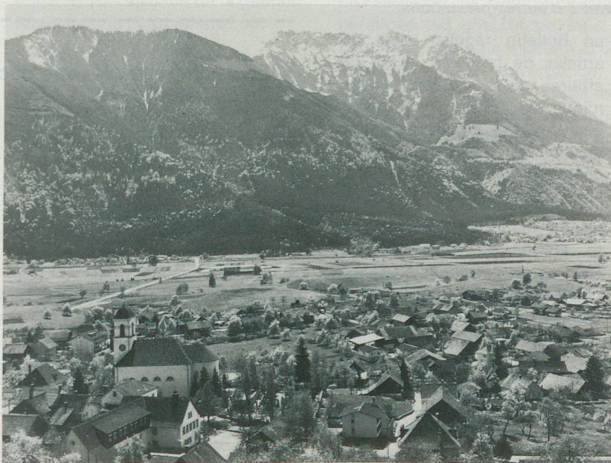
Le Liechtenstein se distingue par son paysage varié...