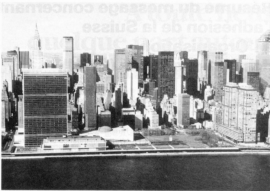
L'ONU à New York

transformé la nature des conflits et ceci a conduit l'ONU à concevoir de nouvelles méthodes de maintien de la paix , telles que l'envoi de missions de médiation ou d'observation et de contingents de Casques bleus. L'ONU a créé ainsi, sur une base volontaire, un instrument capable de créer les conditions préalables à un règlement pacifique ou de contribuer à la recherche d'un tel règlement.