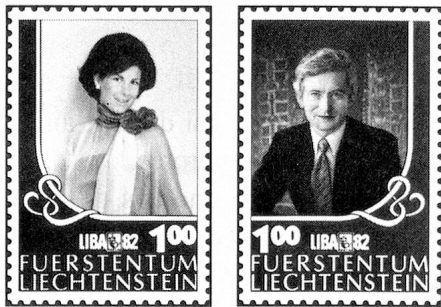
Timbres spéciaux «LIBA '82»