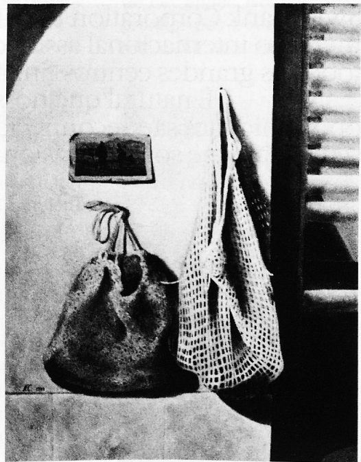
Norbert Clément «L'Angélu» (Pérou)