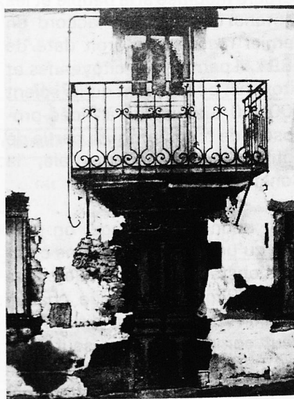
Josef Schibli «Portrait d'une maison III» (Suède)