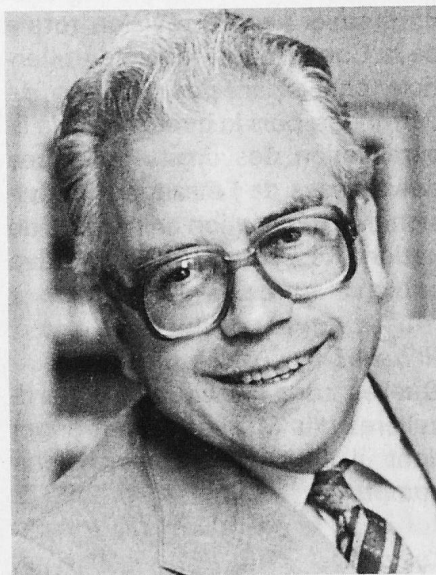
Le chancelier fédéral Walter Buser

La Chancellerie fédérale constitue l'état-major du Conseil fédéral, l'organe central qui coordonne ses travaux et prépare ses séances. Elle assiste le président de la Confédération dans la direction des affaires gouvernementales.