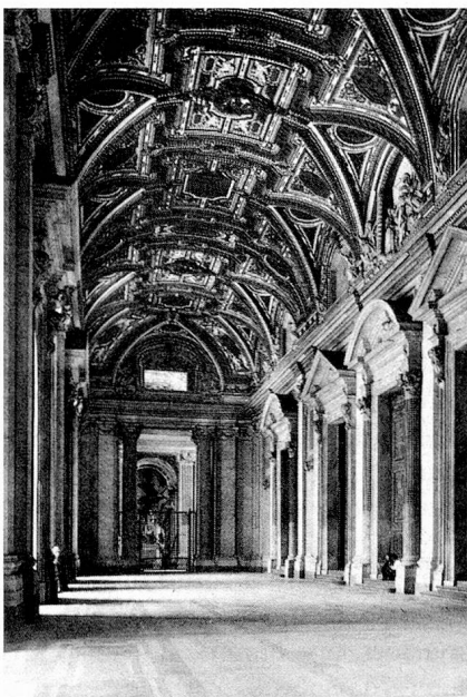
Entrée de la basilique Saint-Pierre. La voûte en stucs.