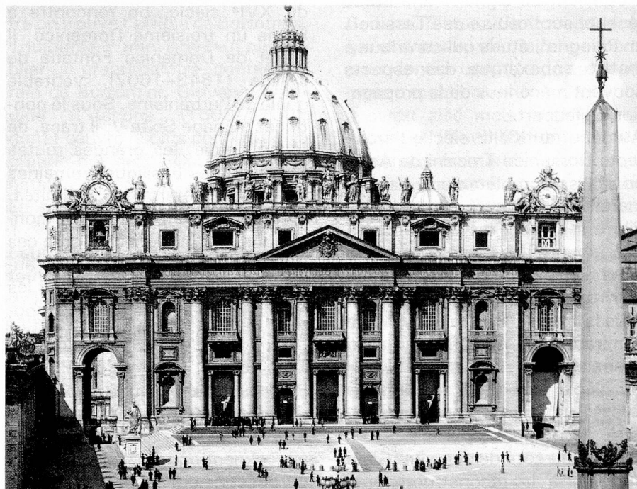
Façade de la basilique Saint-Pierre, à droite le célèbre obélisque

On vient de faire allusion à la période romane, qui restera marquée par une intense activité des Tessinois, en Italie et ailleurs. Une autre période tout aussi fructueuse se situe entre la fin du XVI e siècle et la moitié du XVII e , surtout à Rome, précédant l'ère néo-classique, qui s'est concrétisée par des