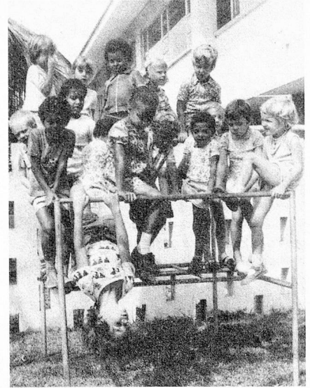
Ecole suisse à Accra.

C.Z. A titre personnel, je relèverai que la loi actuelle a été conçue avec beaucoup d'enthousiasme et d'engagement, mais qu'elle n'a pas assez pris en considération deux éléments fort importants: l'absence de véritables compétences fédérales en matière scolaire et les implications financières, notamment au niveau des salaires. Il en est résulté passablement de mécontentement, alors même que la Confédération – cas unique en cette période de coupes sombres dans les subventions – n'a aucunement réduit ses versements obligatoires; elle s'est contentée de renoncer à certaines prestations que la loi prévoyait à titre facultatif. N'oublions pas que la Con-