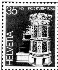
35 + 15 c. Landesmuseum, Zürich Musée nationale suisse, Zurich Museo nazionale svizzero, Zurigo

Cette année, le produit du Don de la Fête nationale est en faveur des oeuvres des Suisses de l'étranger. La première collecte ayant eu ce même but date de 1924, d'autres suivirent tous les six ou sept ans. Les bénéficiaires en seront donc l'Organisation des Suisses de