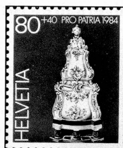
80 + 40 c. Museum Ariana, Genf Musée Ariana, Genève Museo Ariana, Ginevra