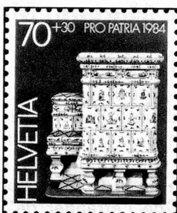
70 + 30 c. Musée gruérien, Bulle