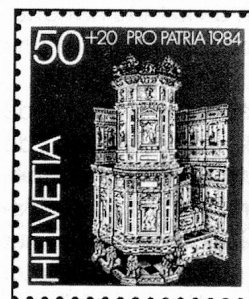
50 + 20 c. Freulerpalast, Näfels Palais Freuler, Näfels Palazzo «Freuler», Näfels