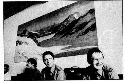
Arrivée à la gare