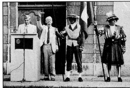
Une clé pour le Professeur Hofer