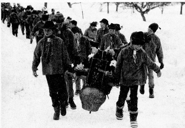
«Chalandamarz» – ein alter Brauch, mit dem die Engadiner Jugend alljährlich den Frühling einleitet.