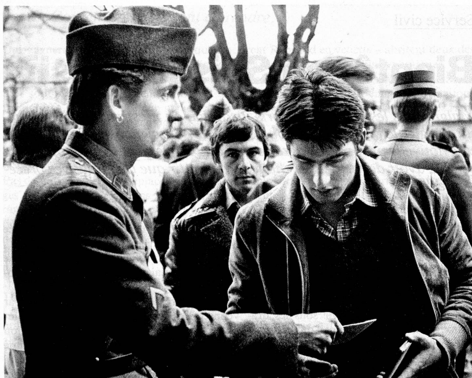
Premier jour de l'école de recrues.