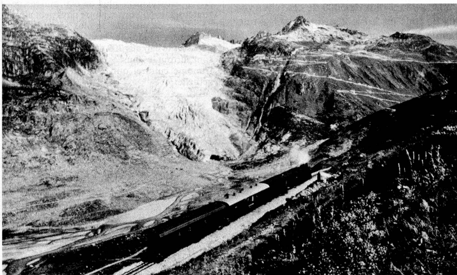
Photo historique prise devant le glacier du Rhône, sur la ligne de la Furka aujourd'hui désaffectée.