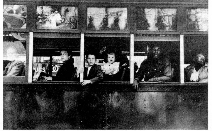
Robert Frank, La Nouvelle-Orléans, 1955-1956