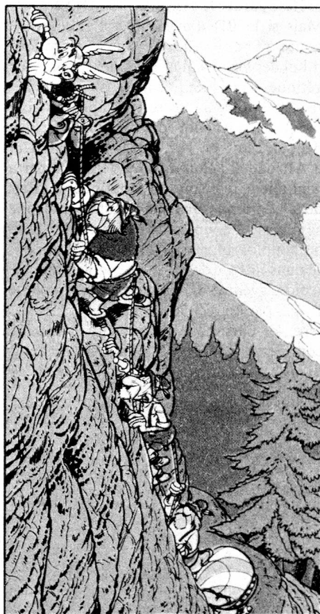
Audacieuse escalade en montagne (dans «Astérix chez les Helvètes»).

Gaulois Astérix avait aussi eu maille à partir avec les Goths, les Normands, Cléopâtre l'Orientale ou les barbares d'Hispanie avant