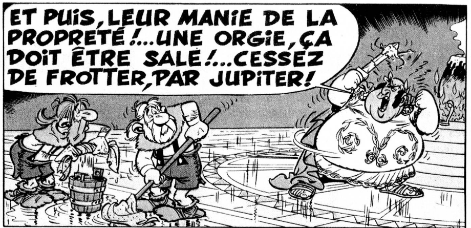
Les Romains ont des problèmes avec la fondue au fromage et la propreté suisse (dans «Astérix chez les Helvètes»).

jeunesse. Publié l'an dernier par le magazine l'Illustré, «Les Helvétiques» a paru interminable même aux fans les plus enthousiastes du grand dessinateur vénitien, aujourd'hui établi à Grandvaux (VD).