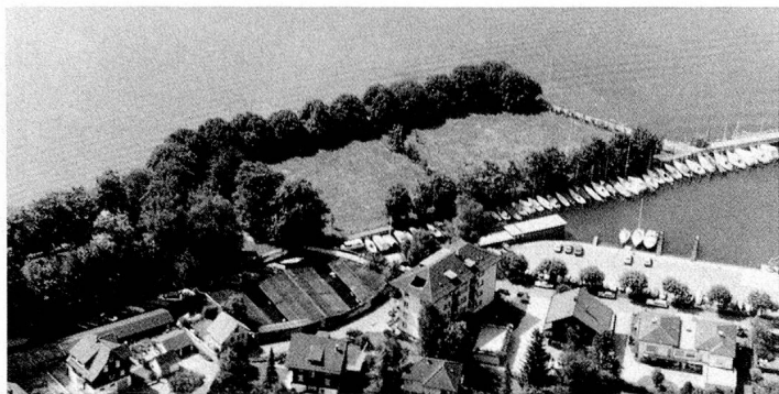
Place des Suisses de l'étranger