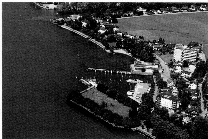
Des architectes suisses de l'étranger seront chargés de l'aménagement de cette presqu'île située dans la baie de Brunnen.

(Fondation Place des Suisses de l'étranger à Brunnen)