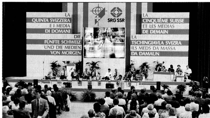
Un congrès consacré aux médias, dans un décor de studio de télévision.

tenir spécialement compte des besoins des Suisses de l'étranger. Cependant, ces bonnes intentions se heurtent actuellement à certaines limites d'ordre technique; beaucoup de Suisses de l'étranger ne le savent que trop bien. Le spécialiste des PTT