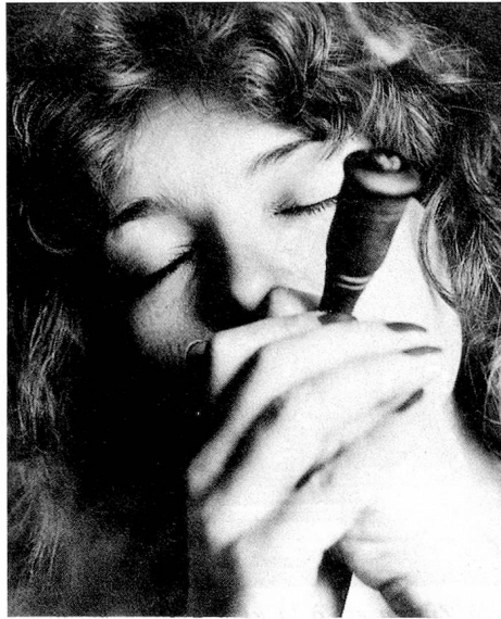
«Chilum», une sorte de pipe pour fumer le haschich.

Si l'on consomme des drogues pour rétablir l'équilibre intérieur détruit par l'ennui, les tensions, le stress ou les conflits, il faut considérer qu'il s'agit d'une tentative d'auto-