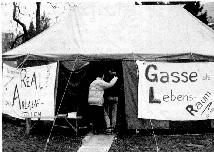
La «Kleine Schanze» à Berne: on accueille les drogués en détresse sous une tente chauffée.

Des slogans du style «La bière, c'est la bonne humeur» ou encore «Gagnez en assurance» (publicités pour de la bière et pour une préparation pharmaceutique) ne sont que deux exemples d'une longue liste d'incitations à consommer des drogues. C'est une façon de mettre en marche le mécanisme.