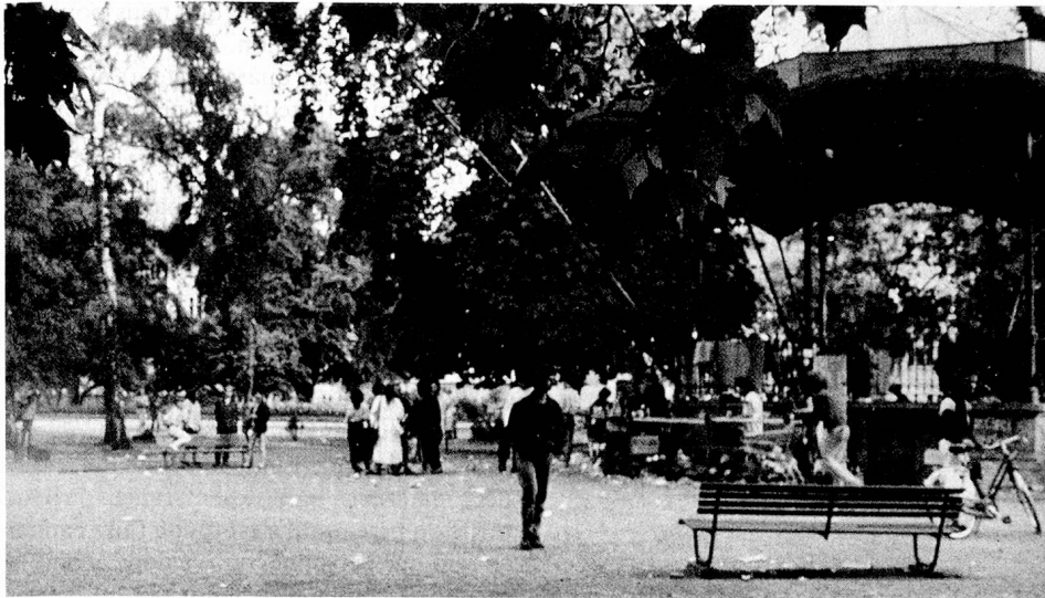
Aujourd'hui, le lieu de rencontre des drogués à Zurich est à la «Platzspitz».

Bush, et par la tendance marquée à la répression dans d'autres pays. Cela peut tenir au fait que la population suisse sensibilisée au problème est très bien informée et que les débats publics se déroulent à un haut niveau. Nombreux sont ceux qui sont conscients du fait que, dans une société libérale, des phénomènes socio-culturels tels que la consommation de drogue exigent une politique prudente.