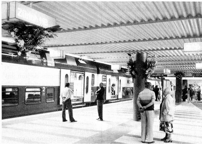
Signe distinctif du train express régional zurichois: les trains navettes modernes à deux étages, ici dans la nouvelle gare «Museumsstrasse».

Un nouveau chapitre dans l'histoire des transports suburbains s'ouvrira à la fin mai de cette année: le train express régional zurichois, qui est le système de transport de l'avenir, sera mis en service. La communauté tarifaire zurichoise, dont font partie les 34 entreprises de transports publics du canton, entrera en vigueur en même temps que sera inauguré le système de train express régional, d'une longueur de 380 kilomètres, qui emprunte en grande partie le réseau des Chemins de fer fédéraux déjà existant. Ce réseau, qui a subi une extension massive par la construction de nouveaux tronçons, de nouveaux tunnels et de nouvelles gares, par l'ac-