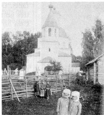
Les enfants du fromager suisse et propriétaire de domaine Emil Rieder devant l'église de Maloe Vosno (Russie) vers 1910.

D'autre part, l'histoire de l'émigration vers la Russie montre qu'il n'y avait pas seulement des gens pauvres et des aventuriers qui émigraient: les trois quarts des passeports établis dans le