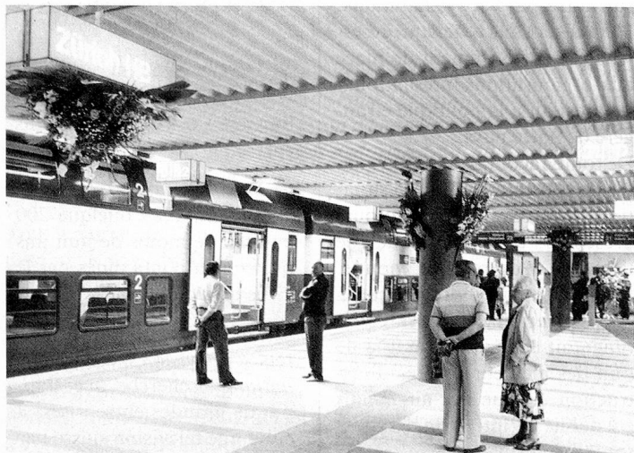
Signe distinctif du train express régional zurichois: les trains navettes modernes à deux étages, ici dans la nouvelle gare «Museumsstrasse».

Un nouveau chapitre dans l'histoire des transports suburbains s'ouvrira à la fin mai de cette année: le train express régional zurichois, qui est le système de transport de l'avenir, sera mis en service. La communauté tarifaire zurichoise, dont font partie les 34 entreprises de transports publics du canton, entrera en vigueur en même temps que sera inauguré le système de train express régional, d'une longueur de 380 kilomètres, qui emprunte en grande partie le réseau des Chemins de fer fédéraux déjà existant. Ce réseau, qui a subi une extension massive par la construction de nouveaux tronçons, de nouveaux tunnels et de nouvelles gares, par l'ac-