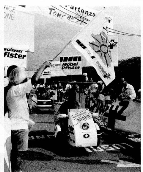
La course de voitures solaires «Tour de Sol», une œuvre de pionniers de l'énergie solaire en Suisse.

■ L'année passée déjà, une installation solaire d'une puissance de 2,5 kW a été mise en service au Titlis. Elle est la plus haute (2540 m) installation solaire du monde qui alimente le réseau. Elle sert notamment à étudier le comportement d'installations solaires dans des conditions atmosphériques extrêmes.