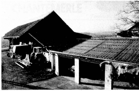
Utilisation de l'énergie solaire dans l'agriculture.