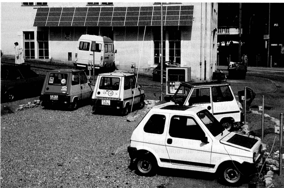
Les voitures électriques font le plein de «soleil» à Liestal.

Ces derniers temps, les pouvoirs publics et des particuliers intéressés ont commencé à soutenir divers projets solaires même dans des secteurs où l'énergie solaire n'est aujourd'hui pas encore vraiment rentable. Peu à peu, les gens ont révisé leur jugement, notamment en raison des catastrophes nucléaires de Three Mile Island et de Tchernobyl, des accidents toujours plus fréquents dans les centrales nucléaires, des modifications prévues du climat dues aux combustibles d'origine fossile ainsi que du fait, connu depuis longtemps, que ceux-ci ne sont pas inépuisables. Tout récemment encore, les pouvoirs publics n'accordaient, dans leurs budgets de la recherche, que des miettes pour la recherche dans le domaine de l'énergie solaire.