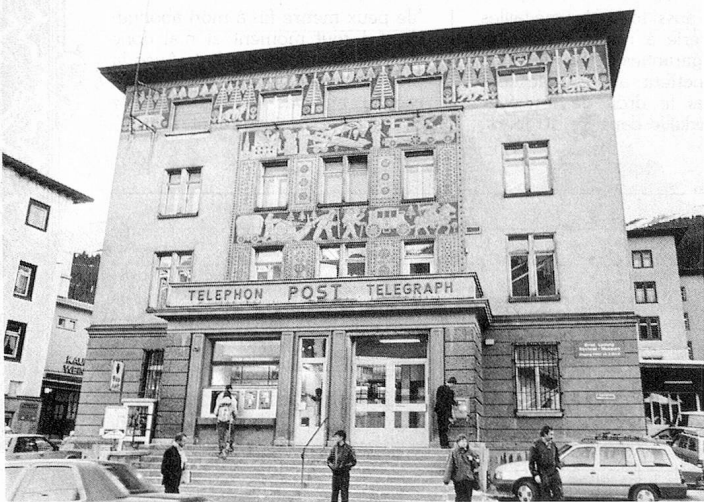
L'ancien Musée Kirchner à Davos.

esquisses et des documents de Kirchner. Mais elle comprend aussi la collection de livres la plus complète qui existe sur l'artiste et son œuvre, ainsi qu'une bibliothèque spéciale sur les arts