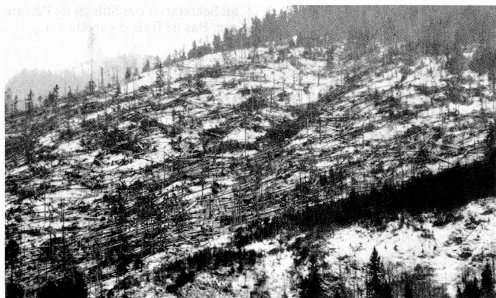
Dégâts dus à la tempête dans le canton de Glaris: des forêts de protection entières ont été dévastées.