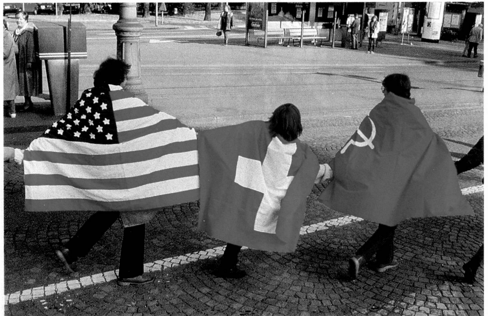
Est et Ouest se tendent la main.

Ils vont de l'école des enfants jusqu'aux attractions dans une discothèque – interdites par la suite – en passant par «l'école des hommes» (le service militaire). Les contrastes se succèdent: après la mort, un tabou, c'est le bal des officiers, puis l'on voit des baraques où sont logés des demandeurs d'asile et immédiatement après des enfants en train de jouer et des enfants malades. Sous le titre ambigu «Le climat de la Suisse», on trouve côte à côte des photos montrant un ordinateur dans une étable et un défilé de mode, un feu de 1 er août et la Foire aux oignons de Berne ainsi qu'une photo particulièrement réussie avec une voiture à