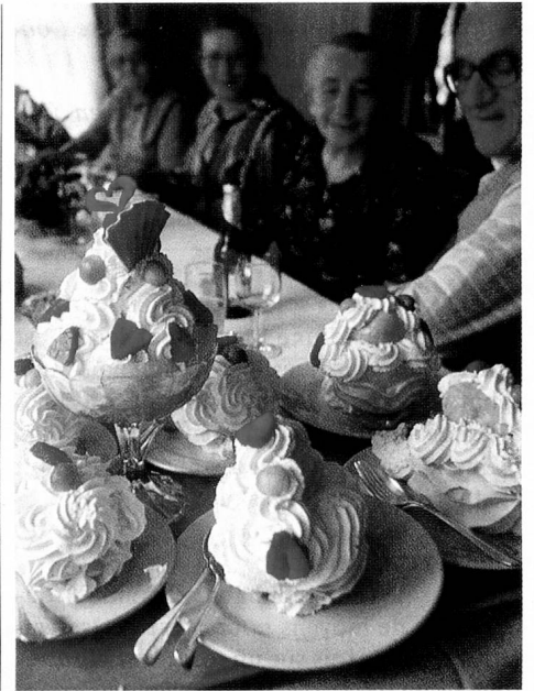
Dessert classique de l'Emmental.

l'impression, à première vue, de voir quelque chose de bien connu, par exemple le monument de Tell à Altdorf; mais en y regardant de plus près, on remarque que l'atmosphère patriotique est sensiblement troublée par la présence irrespectueuse, au premier plan, d'un cracheur de noyaux de cerises. La «combinaison» suivante est encore plus pro-