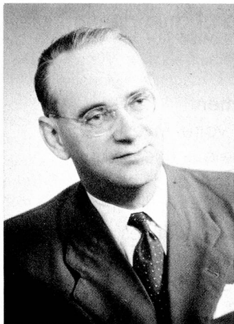
Carl Lutz.

En 1944, Carl Lutz, qui était alors vice-consul de Suisse et chef de la division de la protection à Budapest, a réussi à sauver la vie de plusieurs milliers de Juifs hongrois grâce à une méthode géniale. Un monument de bronze sera inauguré en son honneur au mois de décembre prochain au centre de la capitale hongroise.