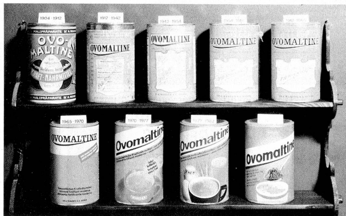
Emballages d'Ovomaltine autrefois et aujourd'hui.

Pour beaucoup de gens, Wander est synonyme d'Ovomaltine, et cela à juste titre. Ce produit, composé de malt d'orge, de lait, d'œufs, de levure et d'un peu de cacao (sans sucre ni substances de lest) a été l'une des premières créations de Wander et a connu le succès dans le monde entier. Mais l'Ovomaltine n'est pas simplement née de l'idée géniale d'un jour, mais a été le fruit de nombreuses années de recherche et d'étude de nouvelles méthodes. Cependant, cette entreprise, qui n'occupait à ses débuts que