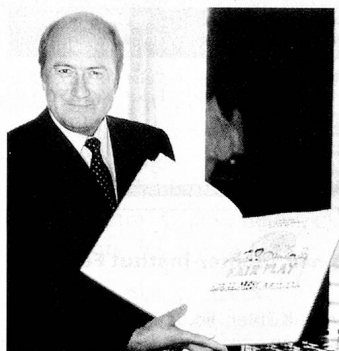
Joseph Blatter.

En sa qualité de secrétaire général de la FIFA (Fédération Internationale de Football Association), le Valaisan Joseph Blatter travaille plutôt dans les coulisses des événements sportifs. L'année passée, l'Association Suisse du Sport (ASS) lui a décerné le prix du fair-play. D'ailleurs, le «Mondiale» a été entièrement placé sous le signe du fair-play. Concrètement, cela signifie que des mesures appropriées ont été prises sur le terrain de jeu, comme l'introduction d'une nouvelle règle selon laquelle le joueur qui reçoit une carte jaune ou une carte rouge doit payer lui-même l'amende, et non pas, par exemple, l'association dont il fait partie. Le carton rouge coûtait déjà 10 000 francs au premier tour du