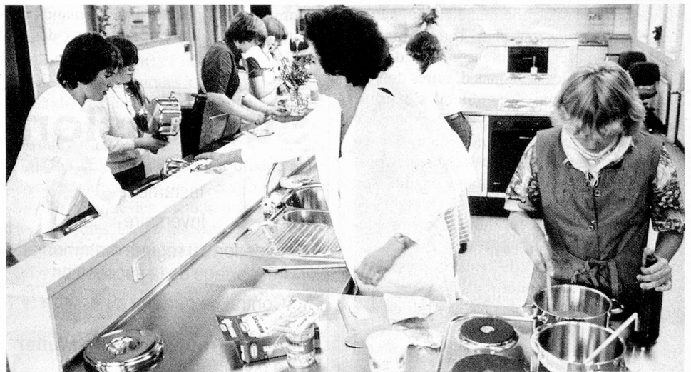
Lors de certaines leçons, les professeurs préfèrent le dialecte au bon allemand, langue scolaire et «colonisatrice».

Un premier mouvement sérieux de réaction contre cette «colonisation» culturelle prit naissance à Berne avant la Première Guerre mondiale déjà, mouvement qui s'étendit bientôt à toute la Suisse alémanique après la défaite de l'empire. Les grands principes de