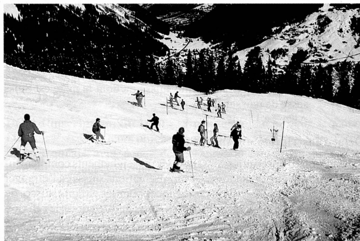
Grâce à des méthodes attrayantes, les participants apprennent à skier en jouant.

Le nombre des participants est limité à 60.