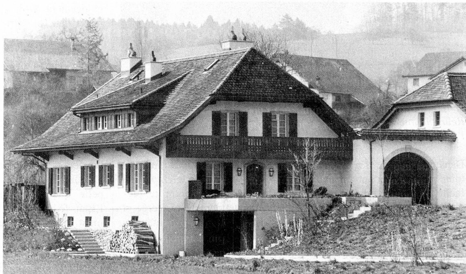
En comparaison au reste de l'Europe, la Suisse est mal placée: 30 pour cent seulement de tous les logements sont occupés par le propriétaire même.

Beaucoup de gens craignent que, dans quelques années ou quelques décennies, la Suisse devienne – là où il n'y a pas de montagnes pour empêcher cela – une immense ville avec de grands parcs. Les agriculteurs entretiendraient alors les pelouses et les arbres de haut