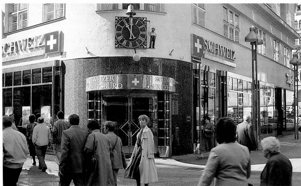
Office suisse du tourisme à la Kärntnerstrasse à Vienne.