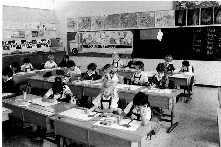
Ecole suisse, Colegio Pestalozzi, à Lima.

Cette modification a été motivée par le fait qu'il y a, dans le monde entier, environ 1800 enfants