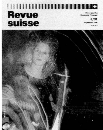
La disco, souvent décriée mais largement fréquentée: la distraction par excellence des jeunes de 14 à 20 ans