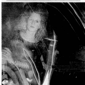
La disco, souvent décriée mais largement fréquentée: la distraction par excellence des jeunes de 14 à 20 ans