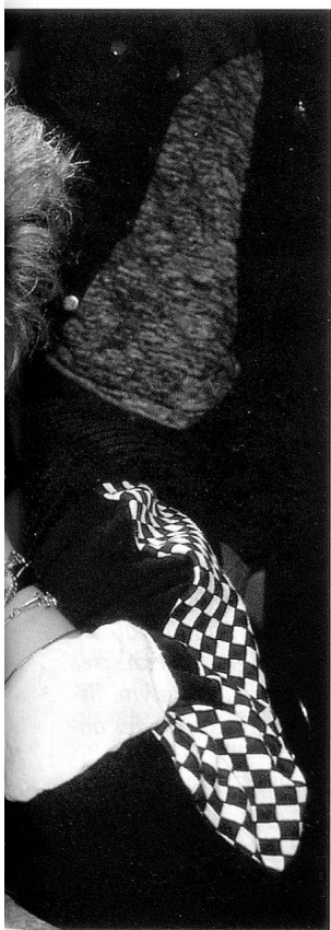
La difficulté de se trouver: la consommation dans l'ennui.

accepté que je fasse de la moto et me montrait les statistiques des accidents. D'une façon générale, il me semble que les personnes âgées ont une vue figée des choses et ne regardent plus que droit devant elles. Bien des choses seraient différentes si elles étaient