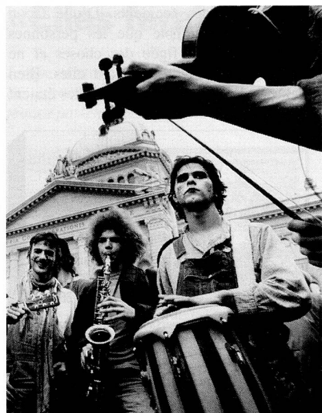
La révolte contre le système.

rédacteur de la revue pour la jeunesse «Dialog»