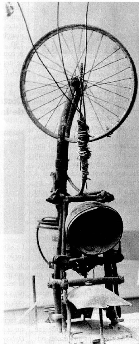
Jean Tinguely. «Hommage à Duchamp», 1965.

Le 29 août s'est éteint à Berne des suites d'une attaque l'artiste fribourgeois mondialement connu, Jean Tinguely, qui était âgé de 66 ans.