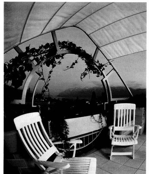
Vue sur le lac Léman et les Alpes

Conçus en duplex et en triplex, avec comme en villa, de larges baies ouvertes sur la nature, ce type d'habitation offre de nom-