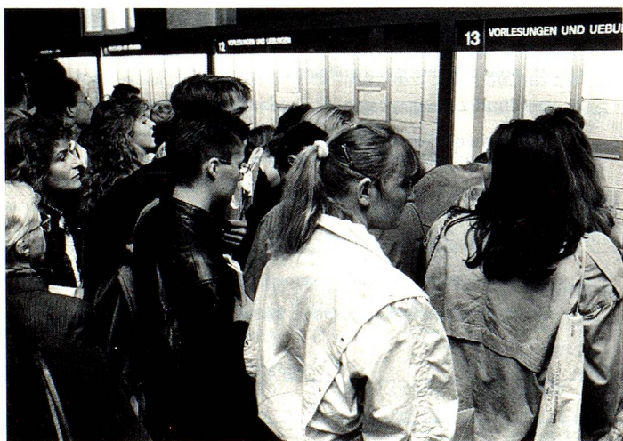
Tout étudiant inscrit dans un pays membre de la CE pourra participer au programme ERASMUS.