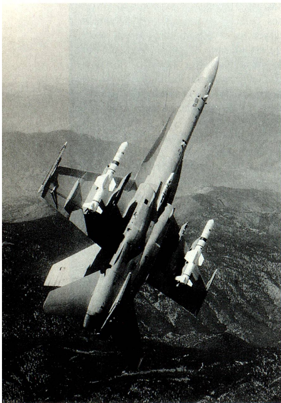
On ne sait pas encore si des «Hornets» voleront un jour avec l'emblème suisse.

Musée du sport, Bâle: Exposition «Du cycle au vélo de course moderne»