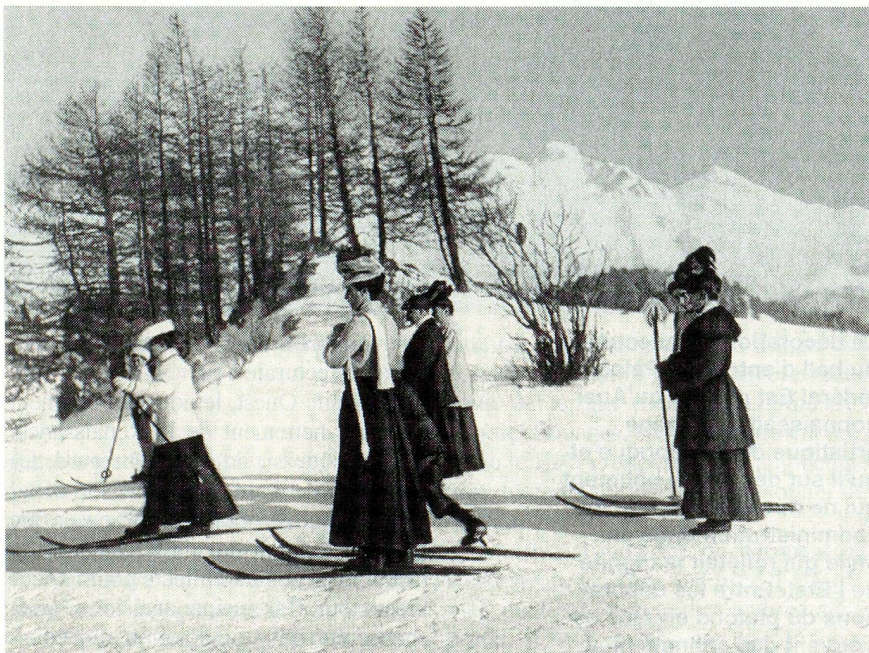
L'Office national suisse du tourisme a été fondé il y a 75 ans: des skieuses de cette époque.

● Dans une caverne militaire au col du Susten (canton de Berne), qui sert à l'entreposage souterrain d'explosifs non recyclables, 300 à 400 tonnes ont explosé pour des causes encore inexplicables. La caverne elle-même est enfouie sous 50 000 m 3 de rochers et de débris. Six personnes ont perdu la vie dans cet accident.