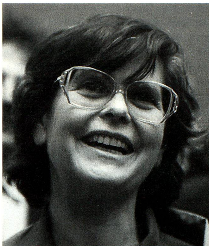
et son successeur Ruth Dreifuss.