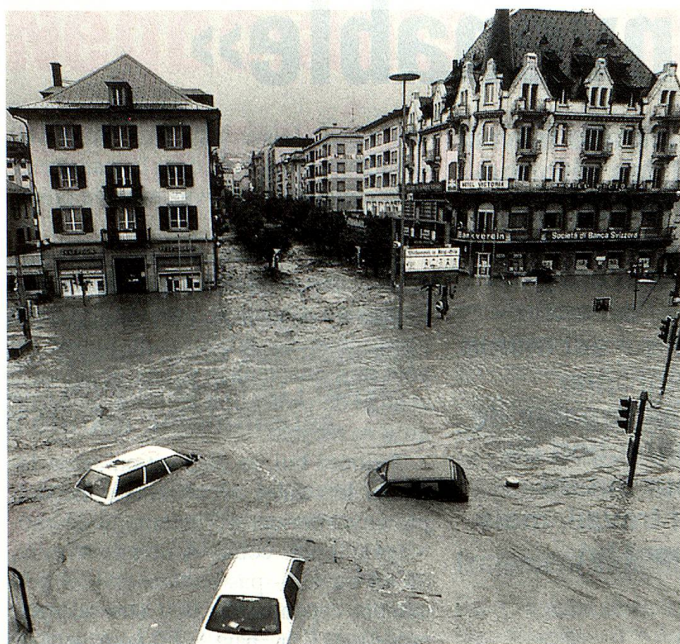
A Brigue, des intempéries catastrophiques ont eu des conséquences dévastatrices.

Des chutes de pluie qui ont duré des semaines ont provoqué de graves dégâts dans plusieurs régions de la Suisse. Au Tessin, de vastes zones du Sopraceneri ont été inondées et l'état d'urgence y a été décrété. Le Lac Majeur ayant atteint un niveau record, des villes telles que Locarno et Ascona ont été recouvertes d'eau.