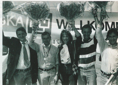
...et aussi les cavaliers.

de francs à des sportifs d'élite. Cela ne suffit naturellement pas pour permettre aux athlètes d'exercer leur activité d'une manière encore plus professionnelle. Il ressort d'une analyse que le sport génère actuellement en Suisse un chiffre d'affaires compris entre 16 et 18 millions de francs. Aujourd'hui, on porte des baskets non seulement pour le sport mais également en ville. Le sport influence énormément la mode des loisirs, de même que l'hôtellerie, etc. Il est donc normal que les milieux économiques apportent leur contribution afin que le sport, qu'ils utilisent tellement pour leur publicité, puisse à l'avenir également être encouragé, et même davantage que jusqu'ici.