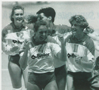
Elles ont de bonnes raisons de se réjouir: les volleyeuses suisses...