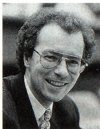
Rudolf Keller, président des Démocrates suisses

C'est en 1961 qu'est née l'Action nationale, rebaptisée il y a cinq ans «Démocrates suisses». Elle est donc de loin l'aînée des formations de la droite populiste. Sa cause était et reste la défense de l'identité et des valeurs helvétiques contre une présence étrangère jugée trop forte. En 1971, les «nationalistes» remportaient 11 sièges au Conseil national.