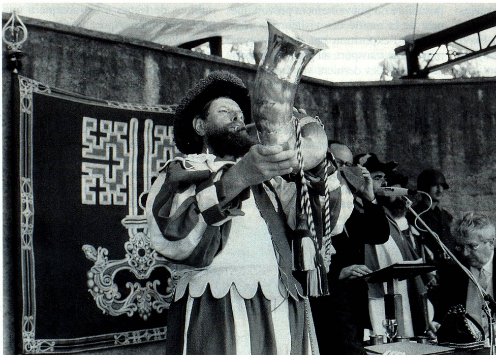
Cette image appartient au passé. La landsgemeinde de Nidwald a vécu.

pation n'a pas dépassé 47 %. Des landsgemeinde existent encore dans les deux demi-cantons d'Appenzell, à Glaris et à Obwald. Vraisemblablement, en 1998, il y aura, dans le canton d'Obwald, des votations pour la suppression de la landsgemeinde. ■