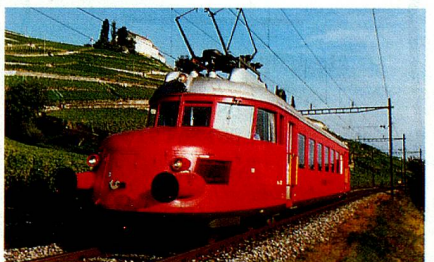
RAe 2/4 (construction 1935-1938)