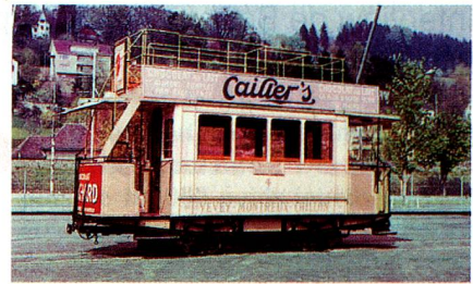
Ce 1/2 (construction 1888)

La Suisse est le pays du rail par excellence. Elle dispose d'un des réseaux ferroviaires les plus denses du monde, complété par un non moins important réseau de transports publics constitué d'autobus, de bateaux et d'installations à câbles de montagne. Les voyageurs y sont, derrière ceux du Japon, les plus zélés utilisateurs quant au nombre de courses effectuées. Enfin, avec des parts de 13,5 pour cent des voyageurs-kilomètres et de 38,5 pour cent des tonnes-kilomètres, le réseau ferré suisse figure en tête des réseaux européens. ■