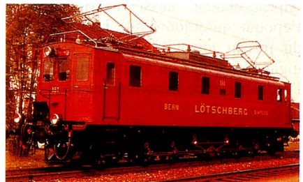
Be 5/7 (construction 1913)