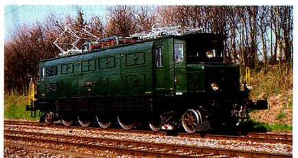
Ae 4/7 (construction 1927-1934)