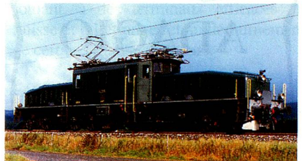
Ce 6/8 (construction 1921-1927)